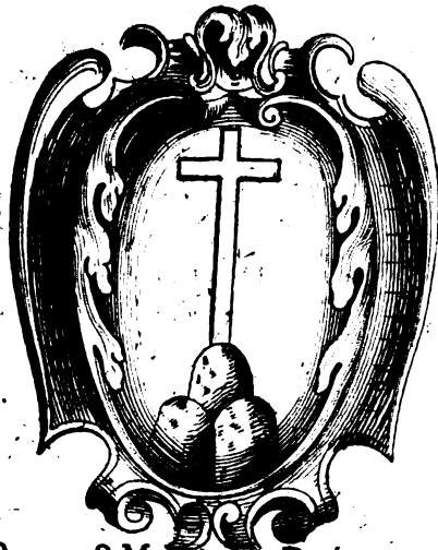
Domus S. Mariae de Divina Providentia Cler. Reg. Pragae.

1110 1111 1112 1113 1114 1115 1116 1117 1118 1119 1120 1121 1122 1123 1124 1125 1126 1127 1128 1129 1130 1131 1132 1133 1134 1135 1136 1137 1138 1139 1140 1141 1142 1143 1144 1145 1146 1147 1148 1149 1150 1151 1152 1153 1154 1155 1156 1157 1158 1159 1160 1161 1162 1163 1164 1165 1166 1167 1168 1169 1170 1171 1172 1173 1174 1175 1176 1177 1178 1179 1180 1181 1182 1183 1184 1185 1186 1187 1188 1189 1190 1191 1192 1193 1194 1195 1196 1197 1198 1199 1200